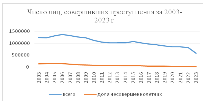
Диаграмма 1. Количество лиц, совершивших преступления за 2003-2023 г.

В тоже время даже положительная динамика преступлений, совершаемых несовершеннолетними, по-прежнему представляет серьезную угрозу для российского общества. На это обращает внимание Председатель